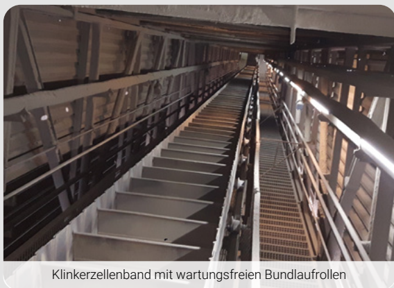
Klinkerzellenband mit wartungsfreien Bundlaufrollen

Führungs- oder Stützrollen werden in der Schüttgutindustrie unter anderem in Elevatoren und Zellenbändern verbaut und sind in der Regel auf einer Achse oder einem Wellenstummel montiert. Die Nachschmierung der darin montierten Kugellager erfolgt über Schmiernippel. Wenn die Schmierintervalle eingehalten und diese Arbeiten korrekt durchgeführt werden, kann eine sehr lange Lebensdauer erreicht werden – immer auch abhängig vom Fördergut und den Einsatzparametern. Meist bietet jedoch eine wartungsfreie Variante wesentliche Vorteile hinsichtlich Standzeit und Wartungsaufwand.